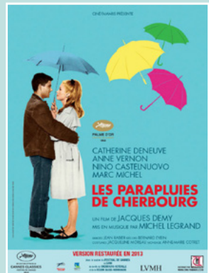
FILM PRÉSENTÉ PAR CHRISTIAN MAGNIN