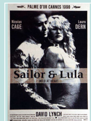
FILM PRÉSENTÉ PAR WILLIAM ROBIN

Attention, la séance de ce vendredi sera jouée exceptionnellement à 20h30 !